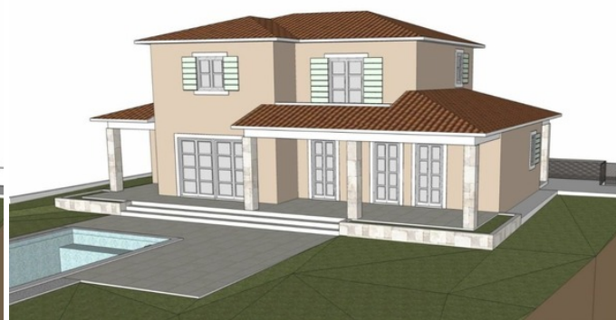
JUGOISTOČNO I SJEVEROISTOČNO PROČELJE

Sveta Nedelja, smještena u središnjoj Istri, poznata je po svom mirnom ruralnom ambijentu i očaravajućem krajoliku. Ova općina obuhvaća brojna slikovita naselja, okružene vinogradima, maslinicima i netaknutom prirodom. Sveta Nedelja nudi autentičan doživljaj Istre, s bogatom poviješću, tradicionalnom arhitekturom i gostoljubivim stanovništvom, čineći je idealnim mjestom za opuštanje i istraživanje istarskog načina života.